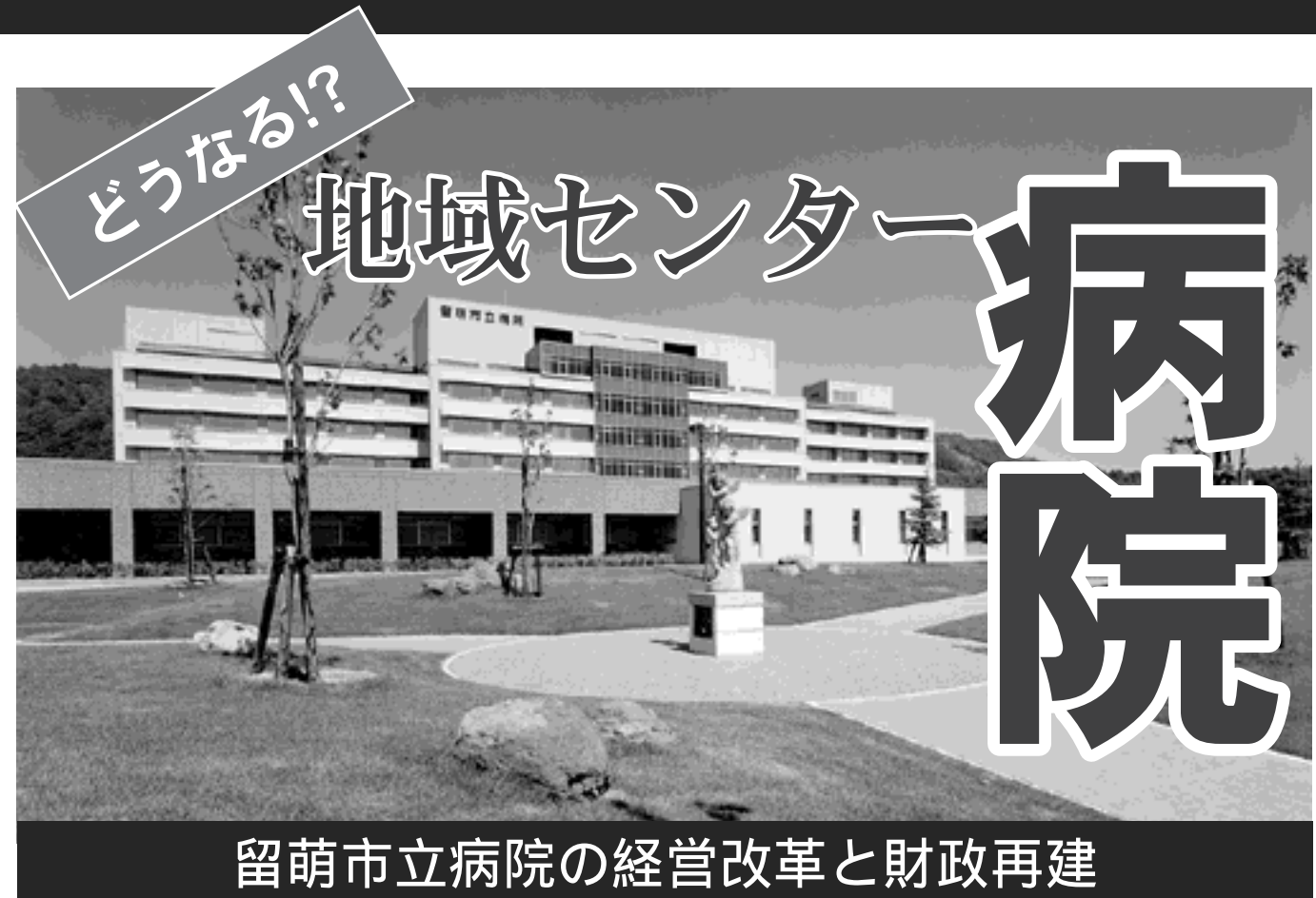
留萌市立病院の経営改革と財政再建

今のままの病院経営を続けると、毎年5~6億円の赤字が発生するため、たとえ、平成20年度に一般会計から病院会計へ特別に15億円の財政支援をしたとしても、平成22年度には、『財政再生団体』へ転落。