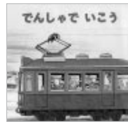
間瀬 なおたか 作/絵

山の駅から海の駅へ、電車がとどる景色は、つぎつぎと様子が変わるたのしい絵本です。